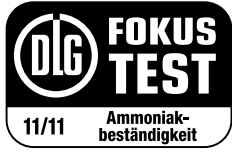
DLG Fokus Test 2011 Ammoniakbeständigkeit