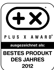
PLUS X AWARD 2012 Bestes Produkt des Jahres