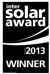
Intersolar AWARD 2013 Solar Projects in Europe